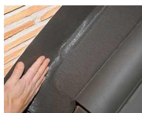
Pegado en ambas zonas de unión. (Paramento-Teja)