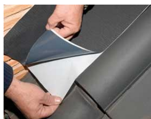
Replanteo y retiro de papel protector posterior.

En el caso de unir dos cintas, solaparlas según el gráfico: