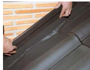
Remate mediante lagrimero y cordón de silicona.