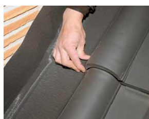
Moldeado y fijación mediante presión.